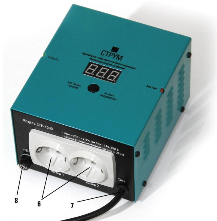
Рис.2 Верхняя панель стабилизатора.

3 – рычаг автоматического выключателя при возведении которого производится включение стабилизатора