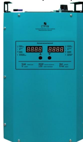
Рис.1 Лицевая панель стабилизатора напряжения

На лицевой панели корпуса (рис. 1) расположены следующие органы управления: