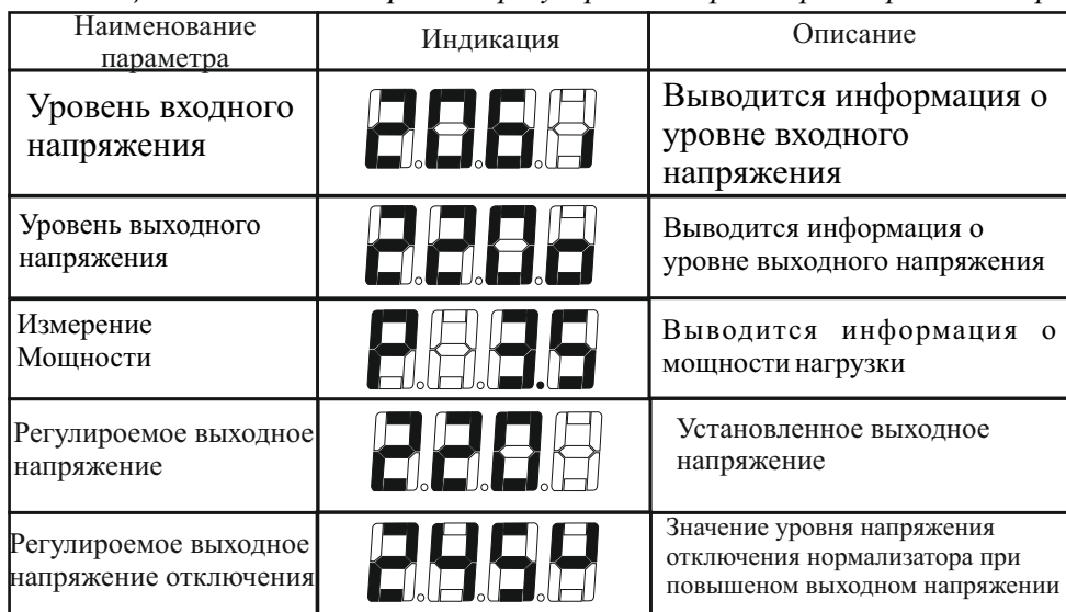
Таблица 5. Режимы измерений и регулировки параметров нормализатора

После включения нормализатора, цифровое табло отображает входное напряжение. Значок <I> в правом нижнем углу указывает на измерение входного напряжения.