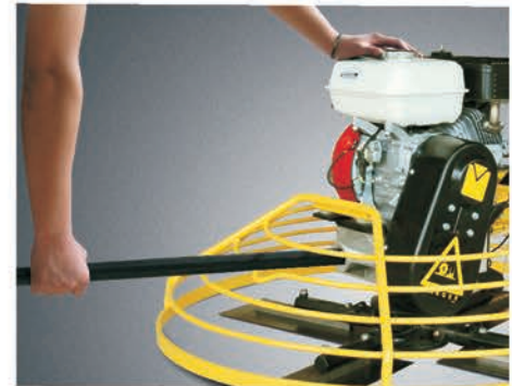
Труба для переноски.