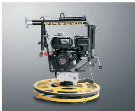
Складная ручка для удобства транспортировки и хранения.