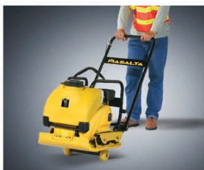
Транспортировочные колеса входят в комплект поставки.

В конструкции этой машины применены новейшие разработки в области эргономики и универсальности. Одновременно мощная и компактная, кроме стандартных видов работ MSR90 может укладывать плитку, горячий и холодный асфальт. Полиуретановый ковер и система орошения входят в комплект поставки.