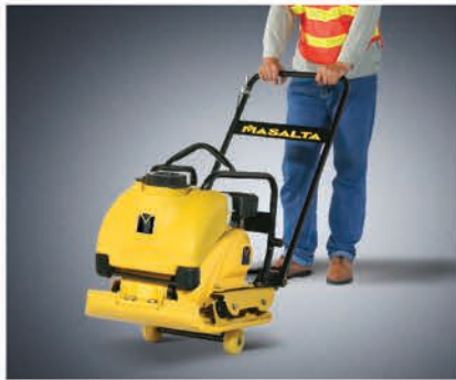
Транспортировочные колеса входят в комплект поставки.

В конструкции этой машины применены новейшие разработки в области эргономики и универсальности. Одновременно мощная и компактная, кроме стандартных видов работ MSR90 может укладывать плитку, горячий и холодный асфальт. Полиуретановый ковер и система орошения входят в комплект поставки.