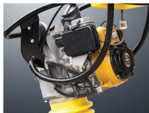
Специальная защитная рама для двигателя