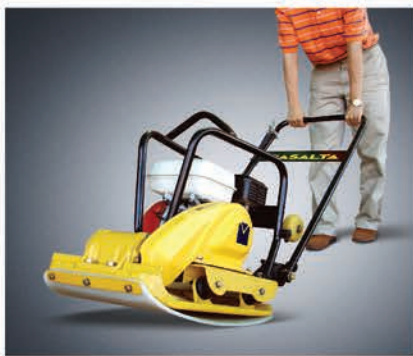
Полиуретановый ковер также входит в комплект поставки.