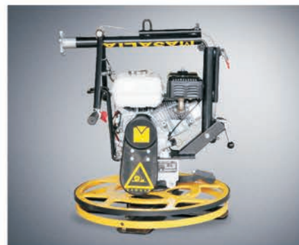
Складная ручка для удобства транспортировки и хранения.